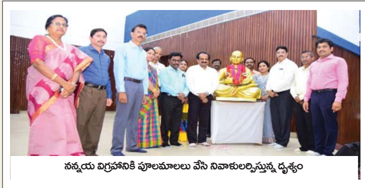
నన్నయ విగ్రహానికి పూలమాలలు వేసి నివాళులర్పిస్తున్న దృశ్యం